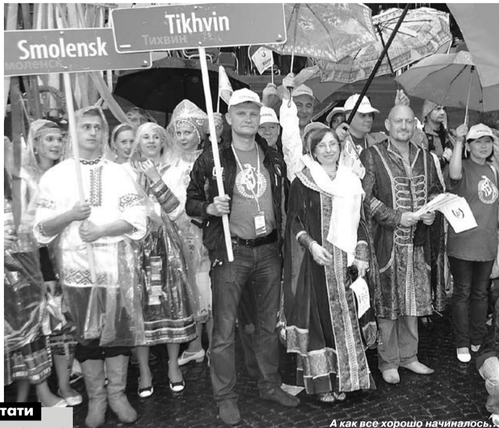
А как все хорошо начиналось...