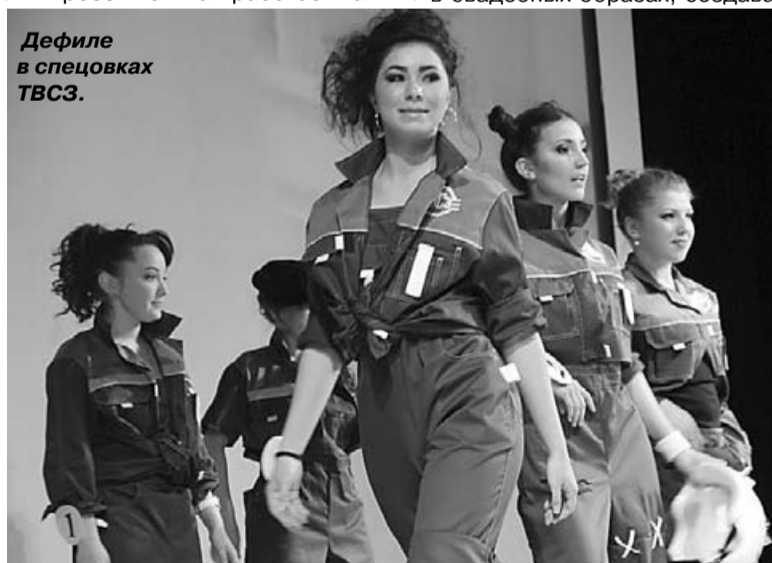
Дефиле в спецовках ТВСЗ.