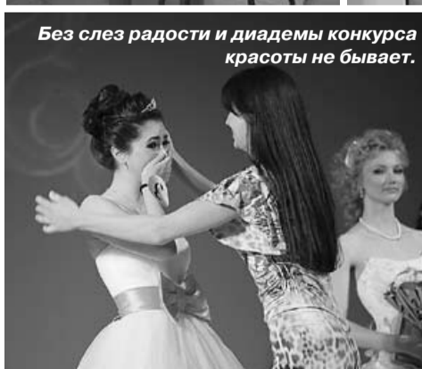
Без слез радости и диадемы конкурса красоты не бывает.