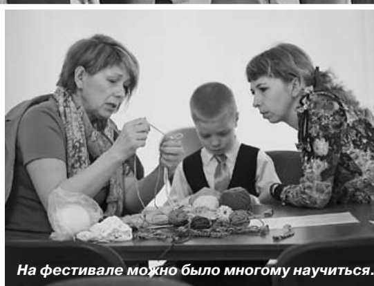
На фестивале можно было многому научиться.