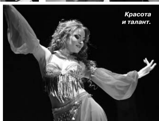
Красота и талант.