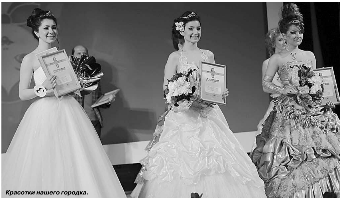
Красотки нашего городка.

Впервые фестиваль «Дизайн-реформа» прошел в Тихвине в октябре 2012 года. Тогда он вызвал большой интерес у горожан, объединив любителей яркого и стильного образа жизни как среди гостей фестиваля, так и среди его участников. В этом году тихвинцы также познакомились с творчеством дизайнеров, мастеров, стилистов, визажистов, фотографов – всех, кто способен воплощать уникальные творческие замыслы в жизнь, приобщая к этому других и вдохновляя на творчество.